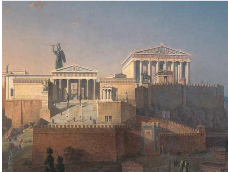
Az Akropolisz, Athén fellelővára, benne a Parthenon épülete

Tervezője Pheidiasz, a neves görög szobrász volt